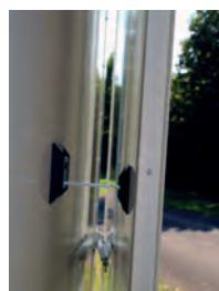
Ouverture portes arrière 270°