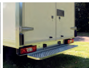
Plateforme d'embarquement grande largeur