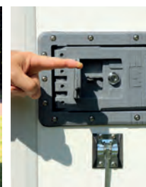
Poignée encastrée sur porte droite