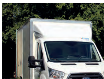
Déflecteur aérodynamique d'origine