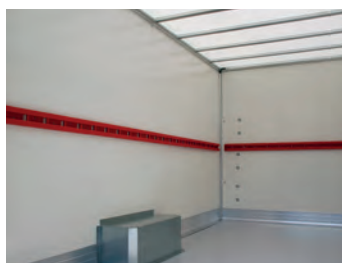
Plancher monobloc revêtement antidérapant - Protection bas de caisse et passage de roue moulé - Pavillon polyester opalescent - Tube d'arrimage (option)