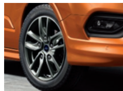
Jantes alliage 18" sur pneumatiques 235/50R18 (De série sur Fourgon Sport 290)