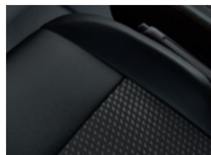
Sellerie cuir*/tissu (De série)