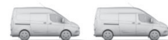
L1 H2 7,2 m³