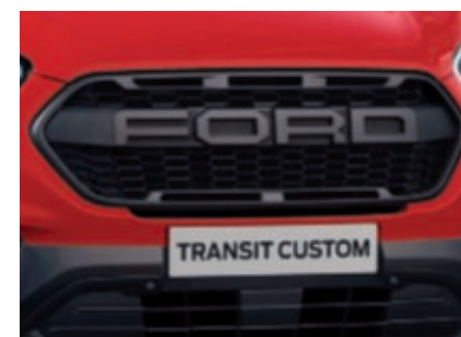
Calandre exclusive noire F O R D (De série)

Modèle présenté : Ford Transit Custom Trail L1 H1 en peinture non métallisée Rouge Racing (De série).