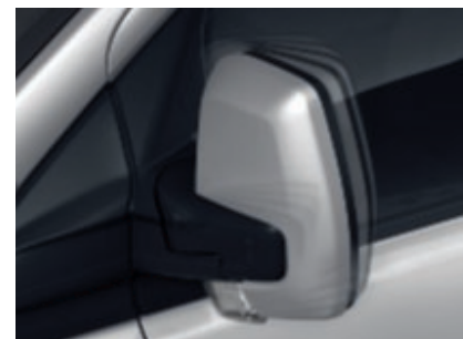
Rétroviseurs extérieurs rabattables électriquement (De série)

Modèle présenté : Ford Transit Custom finition Limited L1 H1 en peinture métallisée Gris Magnetic (option).