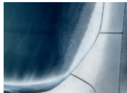
Pare-brise chauffant Quickclear (De série)