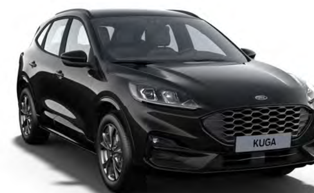
Noir Agate Couleur carrosserie métallisée*