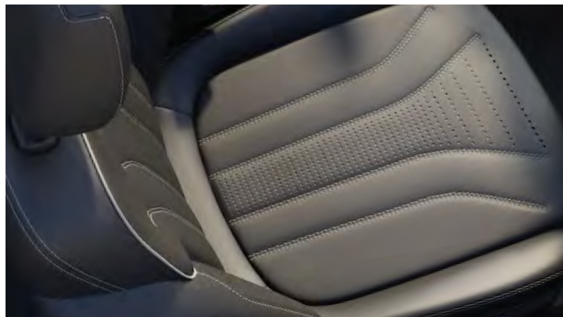
Sellerie Cuir Windsor Arona

De série sur ST-Line X et en option sur ST-Line