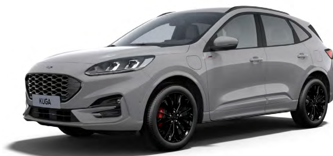
GRAPHITE TECH EDITION