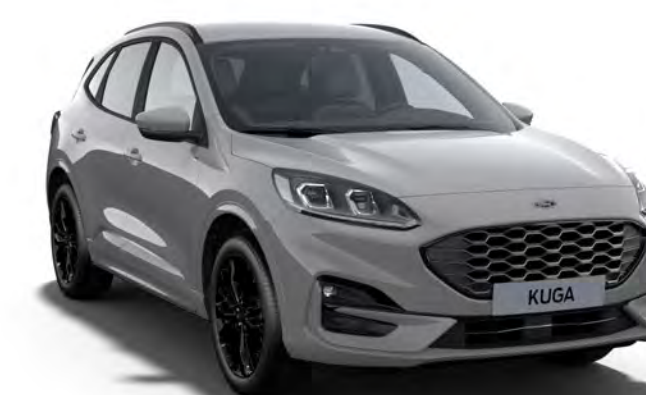
Gris Matter Teinte de carrosserie opaque Premium †