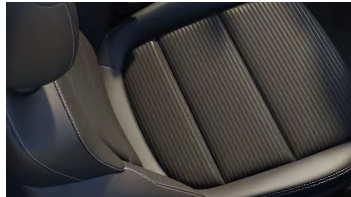
Sellerie tissu noir Ray et Sensico#