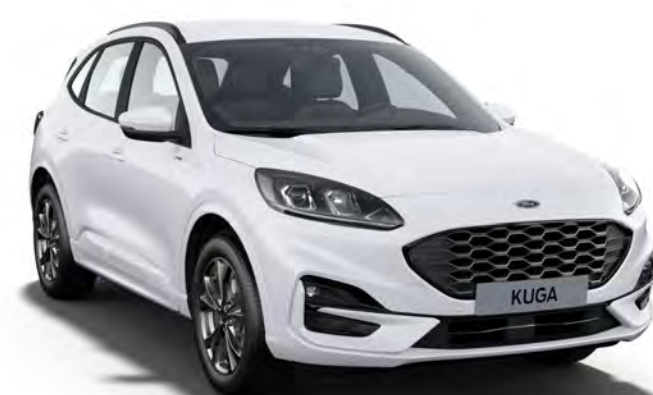
Blanc Glacier ° Couleur carrosserie non métallisée