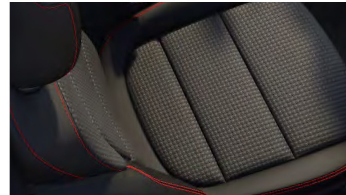
Sellerie tissu noir Foundry avec renforts latéraux Eton