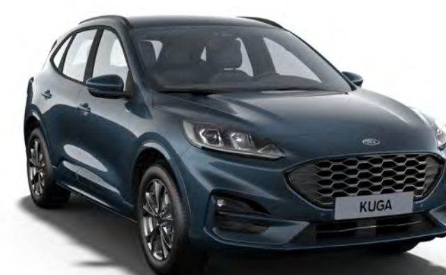
Bleu Azur Couleur carrosserie métallisée*