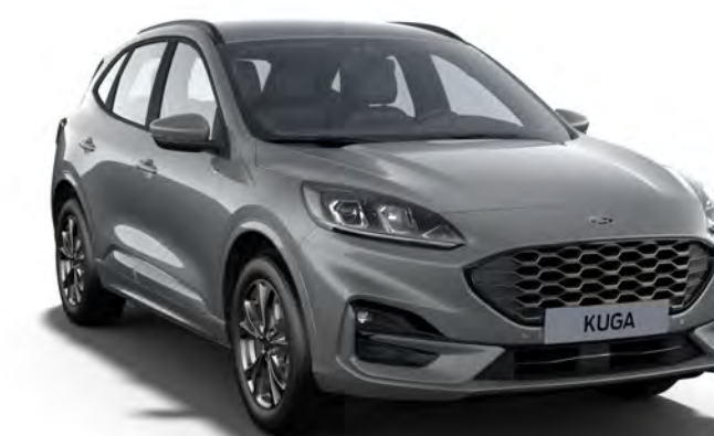
Gris Solar Couleur carrosserie métallisée*