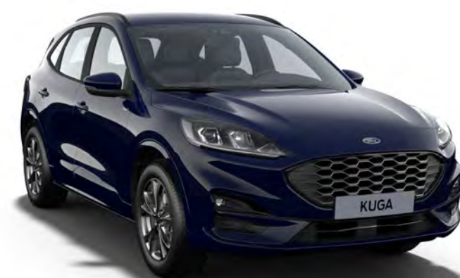
Bleu Abysse ° Couleur carrosserie non métallisée