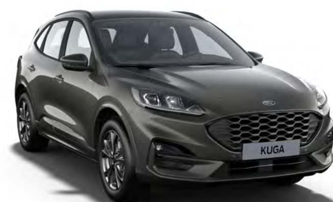
Gris Magnetic Couleur carrosserie métallisée Fashion*

*Option moyennant un coût supplémentaire.