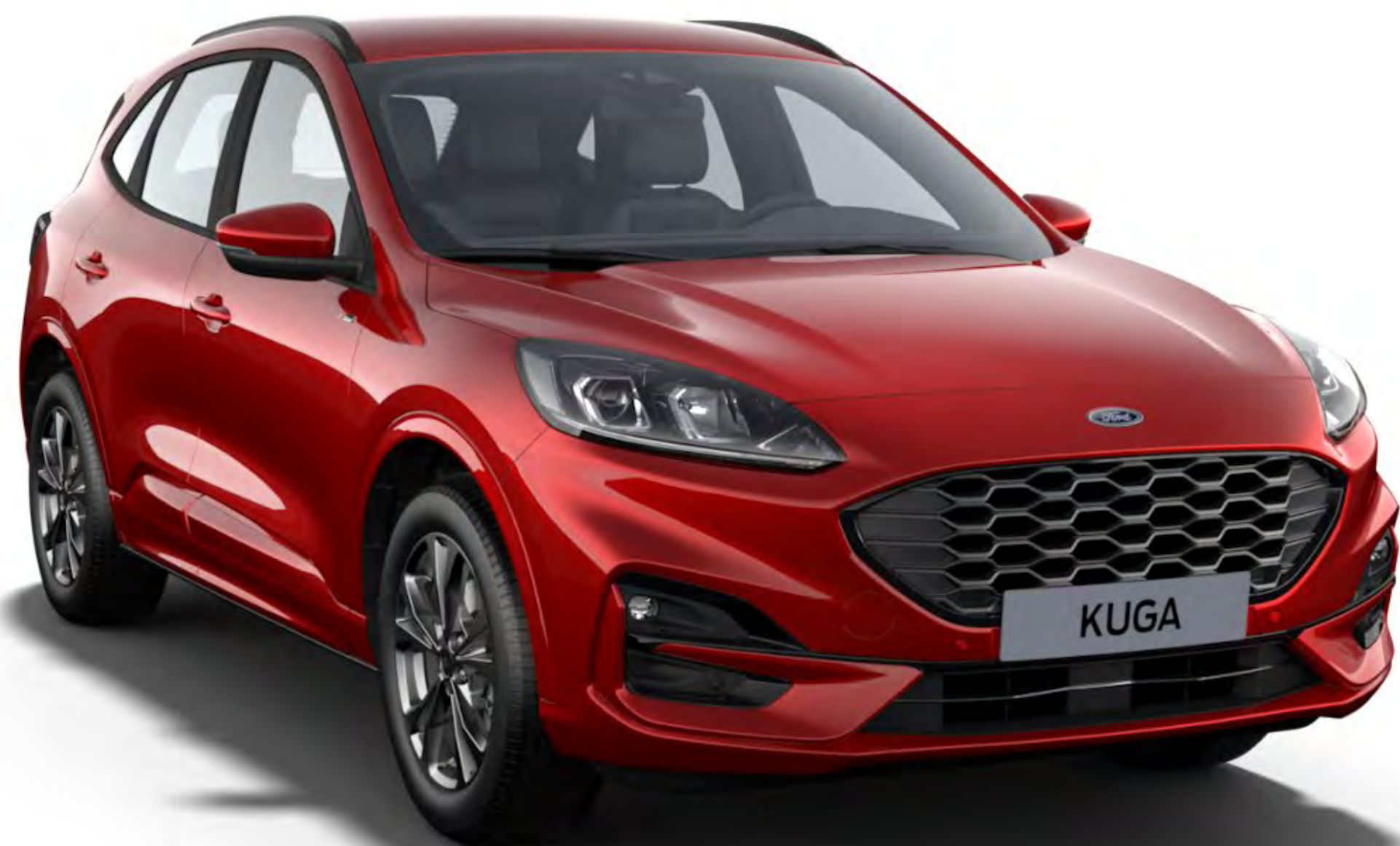
Rouge Lucid Teinte de carrosserie métallisée Premium*

Le Ford Kuga doit son élégance et sa durabilité extérieures à un processus de peinture spécial en plusieurs étapes. Grâce aux nouveaux matériaux et processus d'application ainsi qu'à ses éléments de carrosserie en acier injecté de cire et sa couche de finition protectrice, votre Ford Kuga conservera son apparence séduisante pendant de nombreuses années.