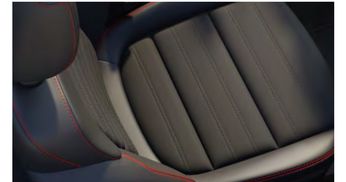
Sellerie Mixte tissu noir Raptan et Sensico Salerno#

De série sur ST-Line X et en option sur ST-Line