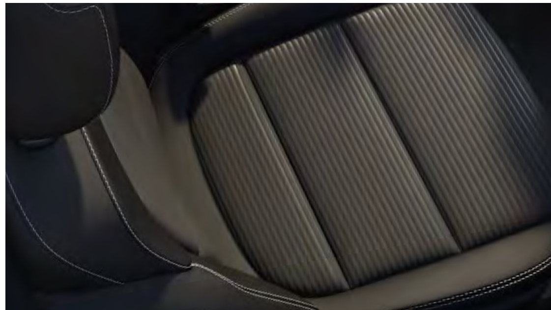
Sellerie tissu noir Ray